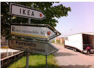
Die Polizei Basel-Landschaft hat bestehende Betriebswegweiser überprüft.