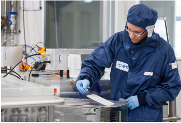
Ein Reinraum im CSEM im Muttenz.